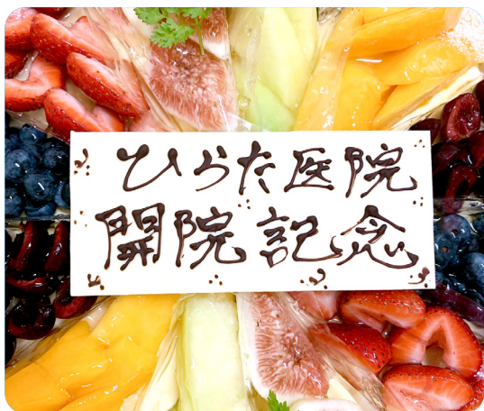
↑先月、「ひらた医院」は開院18周年を迎えたので、職員一同でケーキを食べてお祝いしました！