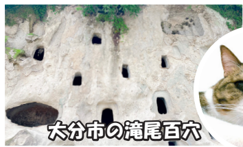
大分市の滝尾百穴