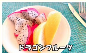
ドラゴンフルーツ