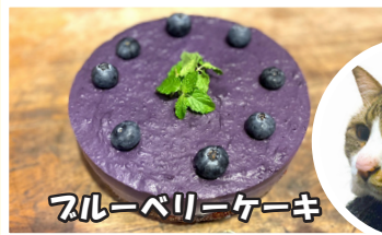
ブルーベリーケーキ