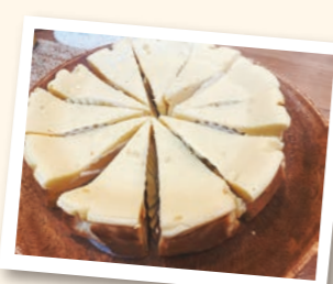
手作りチーズケーキ 1ホール!